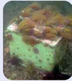
Batterie gisant au fond de la mer

Une autre menace réside dans la pollution aux métaux lourds. Les batteries et les piles sont jetées directement dans la mer et polluent durablement l'eau et la nourriture des animaux marins. Petit à petit l'organisme accumule ces poisons et les animaux finissent par mourir.